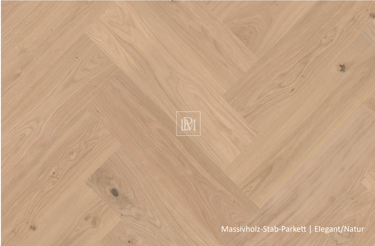
Massivholz-Stab-Parkett | Elegant/Natur