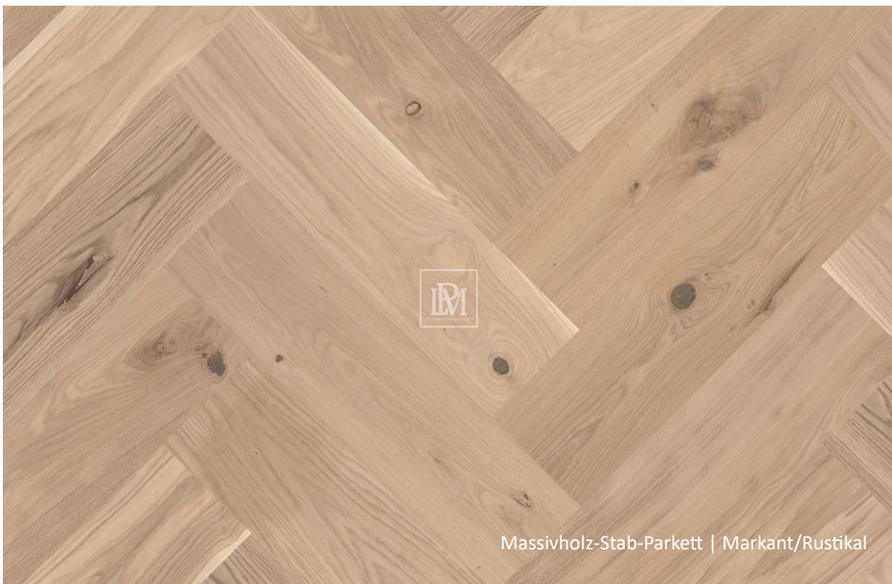
Massivholz-Stab-Parkett | Markant/Rustikal